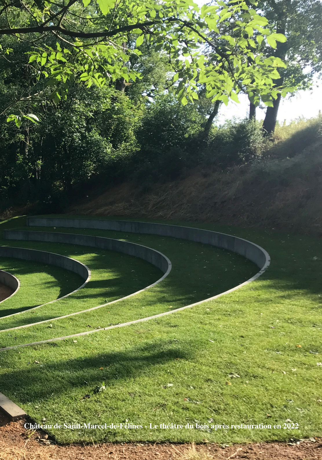
Château de Saint-Marcel-de-Félines - Le théâtre du bois après restauration en 2022