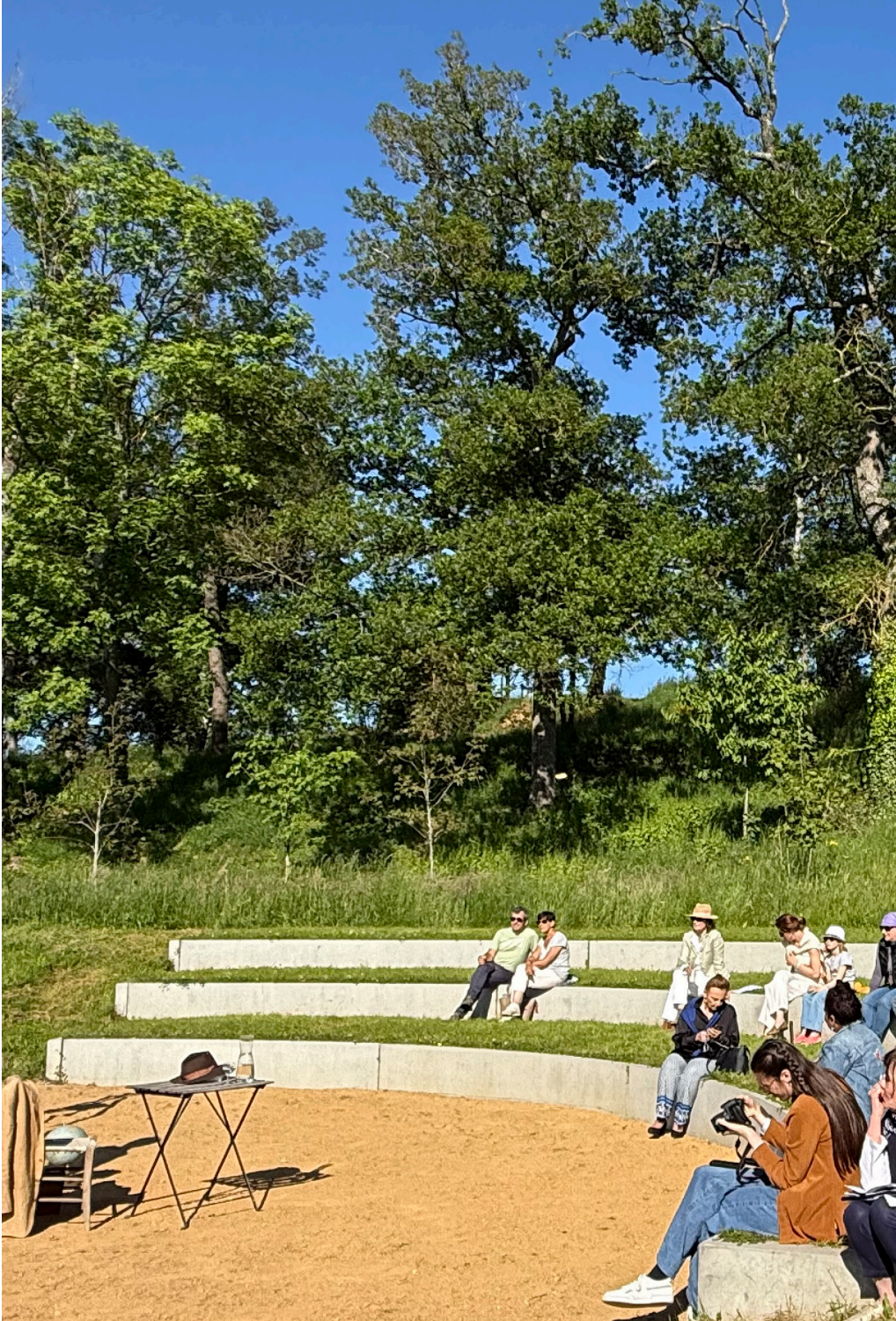
Château de Saint-Marcel-de-Félines - Le théâtre des monts du Forez