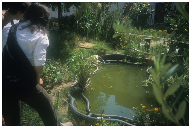
Mare, Papilles et papillons, Paris 20e