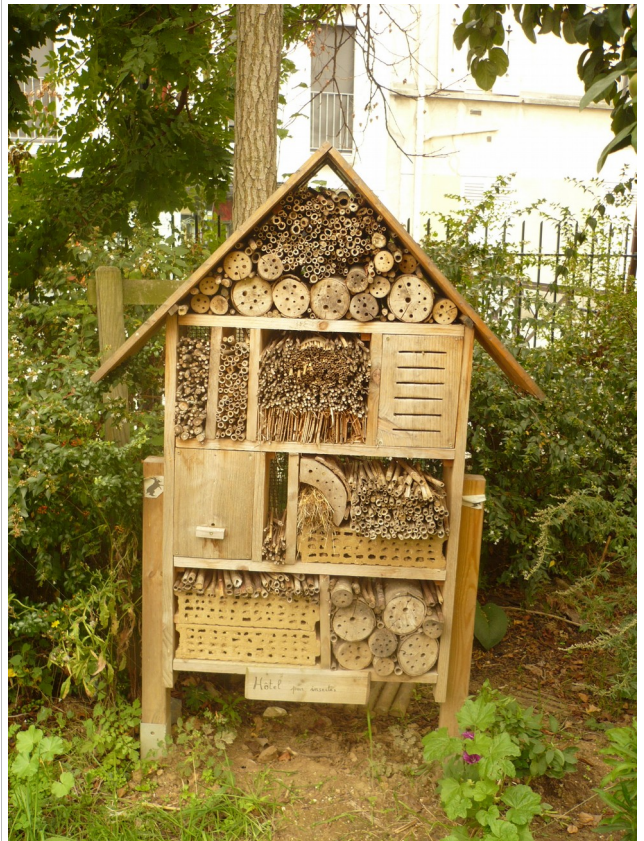
Hôtel à insectes du Lapin ouvrier, Paris 14