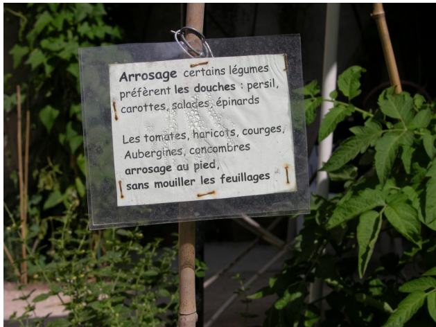
Consignes d'arrosage au Potager des oiseaux, Paris 3e