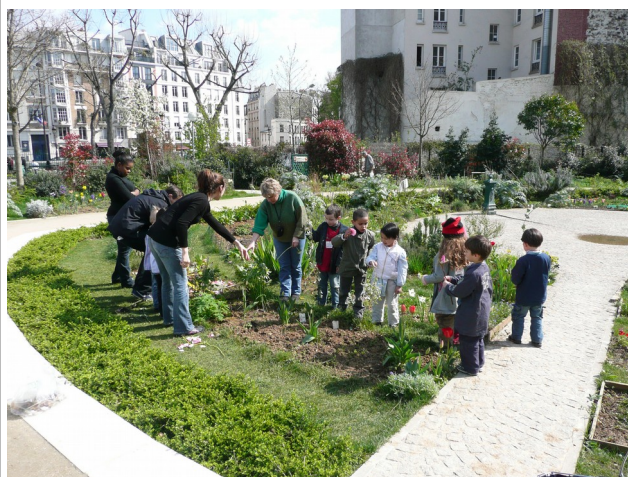
Une classe d'école maternelle au Poireau Agile, square Villemin, Paris 10e