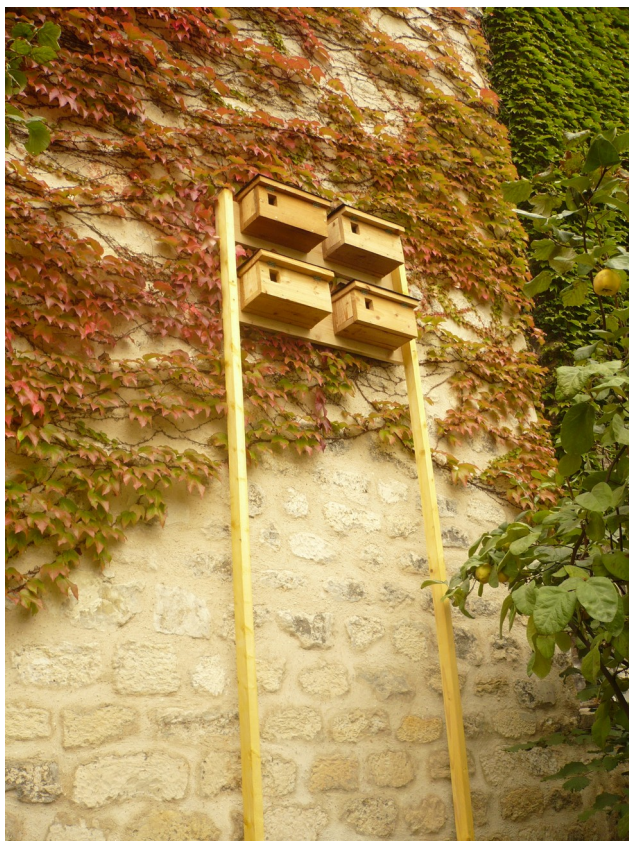
Nichoires, Lapin ouvrier, Paris 14e