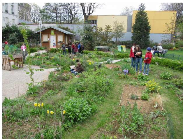
Une classe d'école primaire au Poireau Agile, square Villemin, Paris 10e