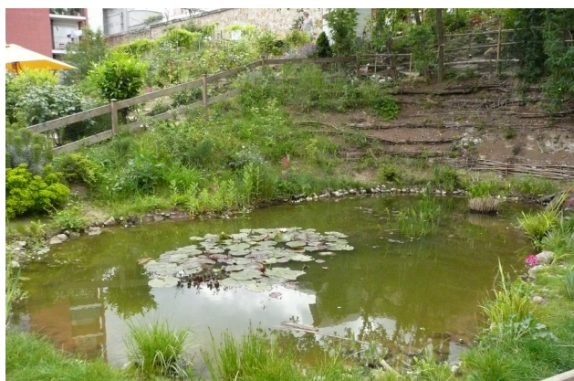
Mare, jardin de L'Aqueduc, Paris 14e